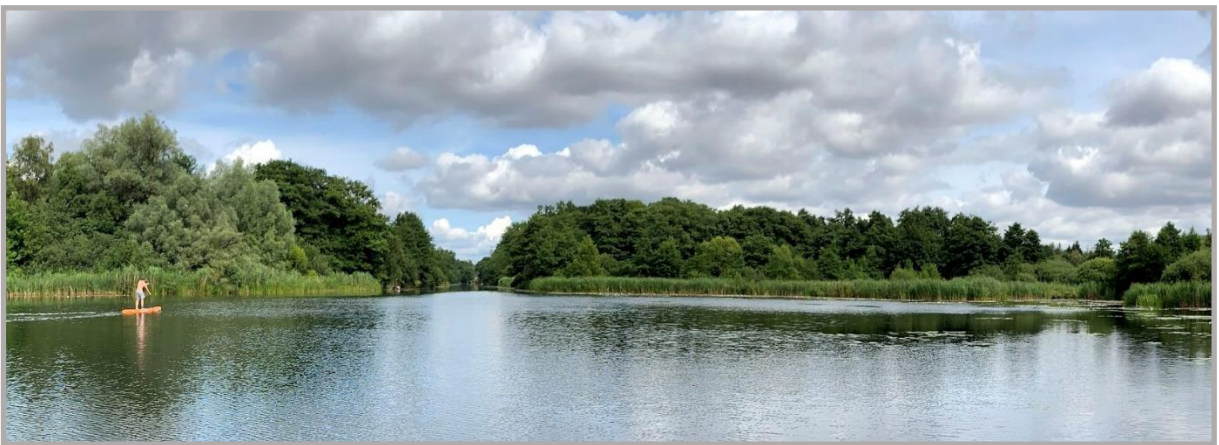
Eider-Ringkanal (Achterwehrer Schifffahrts-Kanal) 2020