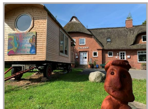
Galerie in der ehem. Grundschule 2020