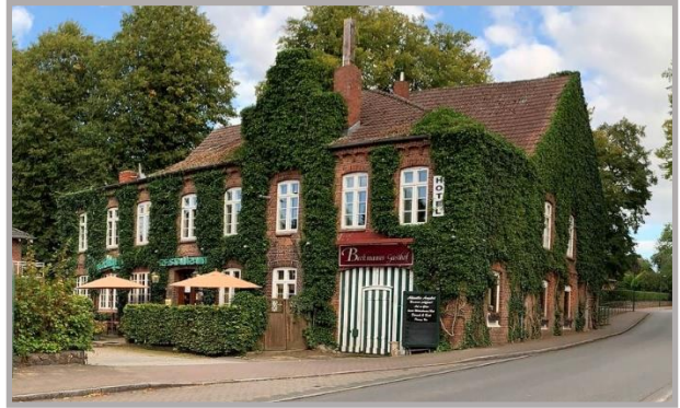
Beckmanns Gasthof 2020